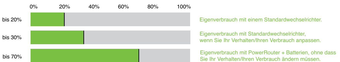
Abb. 1: Maximieren Sie Ihren Eigenverbrauch

Mit Hilfe des PowerRouters können Sie optimal von den finanziellen Anreizen für den Eigenverbrauch Ihres Stroms Gebrauch machen. Es gibt grundsätzlich zwei Möglichkeiten, wie Sie Ihren Solarstrom effizienter selbst nutzen können: Schalten Sie bestimmte Verbraucher (z. B. Geschirrspülmaschine, Waschmaschine) in Zeiten ein, in denen mehr Solarstrom anfällt, oder speichern Sie den überschüssigen selbst erzeugten Strom in Batterien für später. Hierdurch erreichen Sie nicht nur eine höhere Rendite auf Ihre Investition, Sie sichern sich auch ab gegen zukünftige Strompreis- oder Gesetzesänderungen – für mehr Unabhängigkeit.